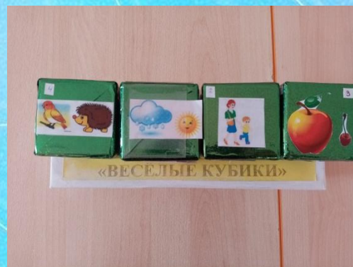
Дидактическое пособие «Веселые кубики» для развития связной речи