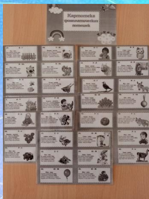
Картотека фонематических потешек