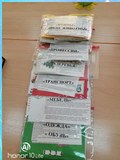
Предметные картинки по лексическим темам