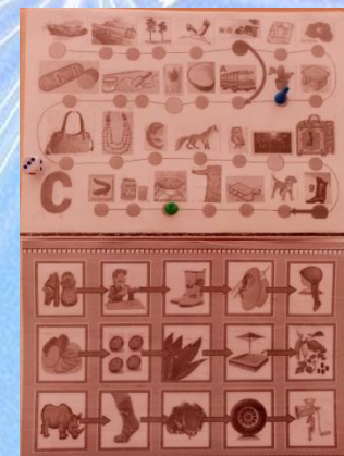
Ходилки-бродилки для автоматизации звуков