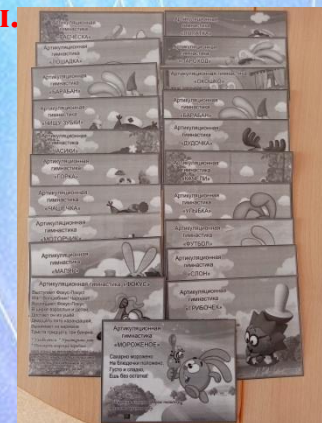
Картотека артикуляционных упражнений