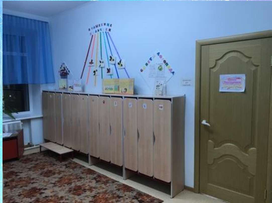
Образовательная среда начинается с раздевалки