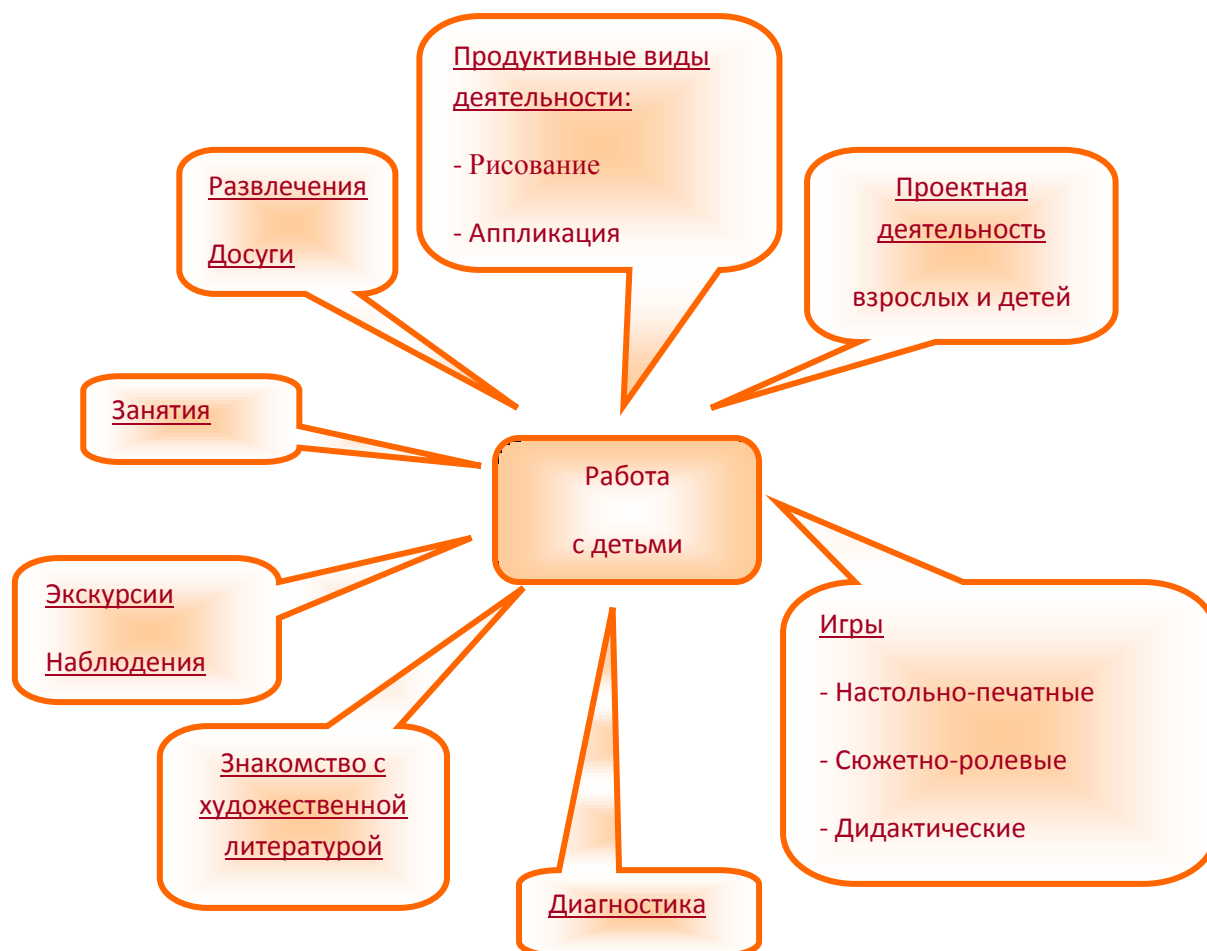
Рис.1 Формы работы с детьми по обучению безопасному поведению на дороге

Работа в ходе реализации программы может быть специально организована, а также внедрена в обычные плановые формы работы.